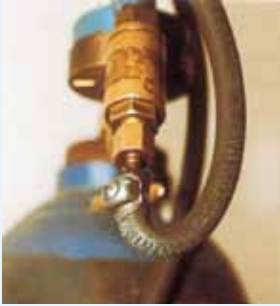
Sauerstoffschlauch, der an der Anschlussstelle der Flammenrückschlagsicherung bereits brüchig wurde