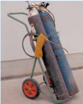
Flaschentransportwagen, mit dem die Gasflaschen im angeschlossenen Zustand transportiert werden dürfen

Beim Krantransport müssen Flaschen in dafür geeigneten Vorrichtungen (Flaschentransportkörbe) aufgenommen sein.