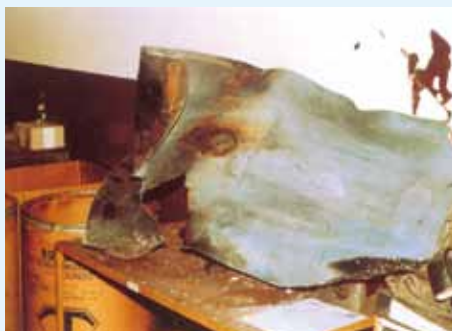
Reste einer Azetylenflasche, die durch eine Azetylenzersetzung zerstört wurde

Azetylen neigt infolge seiner chemischen Struktur bereits bei Temperaturen von 100 °C oder Drücken von 2 bar zur Zersetzung (Azetylenzerfall). Dafür ist weder Sauerstoff noch eine Zündquelle nötig. Dabei fallen starke Erwärmung und hohe Drücke an, die in weiterer Folge zum Bersten der Flasche oder der Geräte führen können.