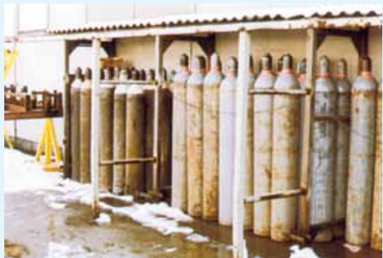
Flaschenlager: Gasflaschen mit verschiedenen Gasen sowie gefüllte und leere Flaschen müssen getrennt voneinander gelagert werden