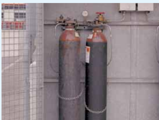
Bei Flaschenbatterien von Flüssiggas sind die Bestimmungen der Flüssiggasverordnung zu berücksichtigen