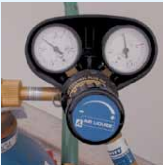
Druckminderer für Sauerstoff mit Kennzeichnung

Für Druckregler, Sicherheitseinrichtungen, Schläuche und Brenner wurden in ÖNORMEN die Anforderungen, die aus sicherheitstechnischen Gründen an solche Geräte zu stellen sind, festgelegt. Diese ÖNORMEN sehen eine „ÖNORM-geprüft“-Kennzeichnung vor. Die ausschließliche Verwendung von ÖNORM-geprüften Geräten und Einrichtungen stellt die Einhaltung dieser Bestimmungen sicher.