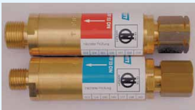
Flammenrückschlagsicherungen, „ÖNORM-geprüft“ gekennzeichnet

Sogenannte Brennerhandgriffsicherungen erfüllen nicht die nötigen sicherheitstechnischen Anforderungen, da sie im Allgemeinen keine Nachströmsperre enthalten.