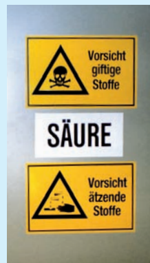
Kennzeichnung von Lagerräumen für Säuren