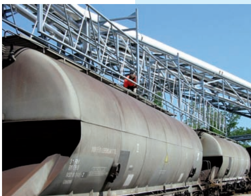
Schwenkbare Bühne, Waggon- entladung

Werden größeren Mengen ätzender Stoffe verwendet, sind in der Nähe der Einsatzorte Notduschen zu installieren. Diese sind einmal im Monat auf ordnungsgemäße Funktion zu überprüfen (BGR 120).