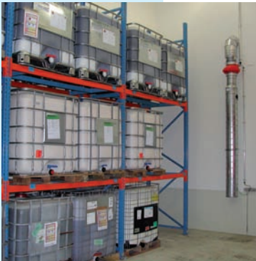
Lagerraum mit mechanischer Belüftung

Damit umweltgefährdende ätzende Stoffe aus undicht gewordenen Behältern nicht ins Erdreich gelangen können, müssen die Lagerräume mit flüssigkeitsdichten Auffangwannen ausgestattet sein (Grundwassergefährdung).