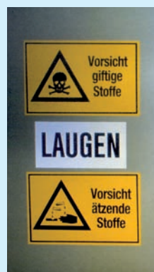
Kennzeichnung von Lagerräumen für Laugen

Reste von Säuren bzw. Laugen müssen getrennt voneinander in verschließbaren, gekennzeichneten und beständigen Gebinden gesammelt und der Entsorgung oder der Rückgewinnung zugeführt werden.