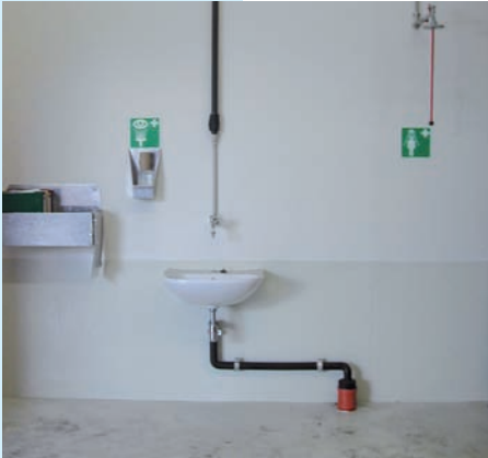
Notfalleinrichtungen in der Praxis

In Arbeitsräumen, in denen mit gefährlichen Arbeitsstoffen umgegangen wird, sind das Essen, Trinken, Rauchen, die Einnahme von Medikamenten sowie die Verwendung von Kosmetika verboten.