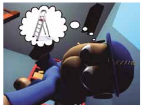
Eine Leiter wäre doch besser ...!