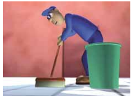
Immer Wasser zuerst in den Kübel!