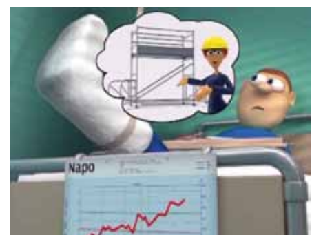
Aufstieg im Inneren des Rollgerüsts!