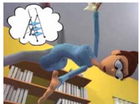
Geeignete Leitern verwenden!