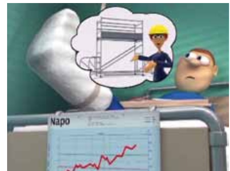
Aufstieg im Inneren des Rollgerüsts!