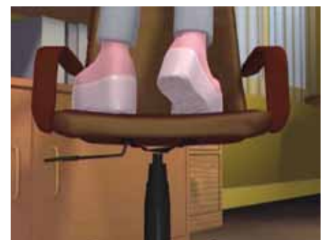
Kein gesicherter Standort!