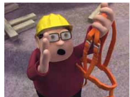
PSA laut Unterweisung verwenden!